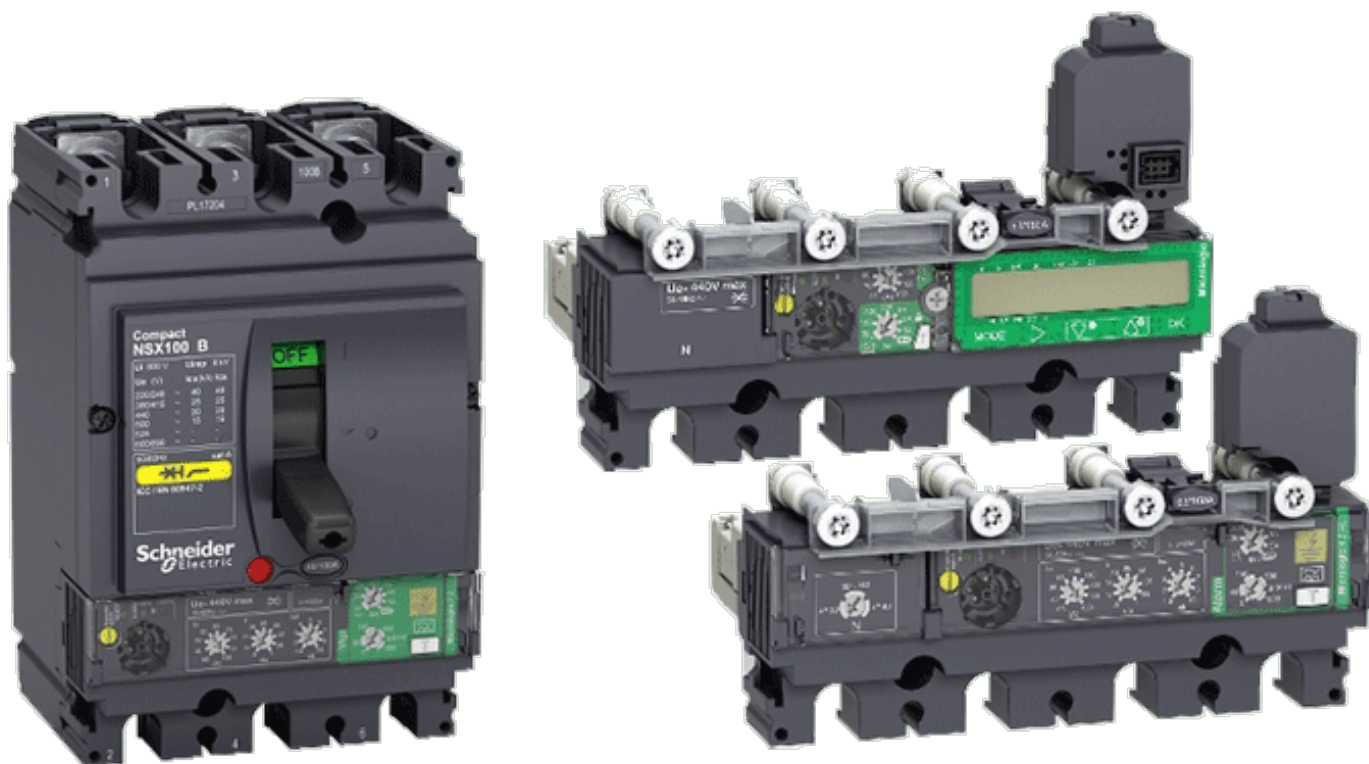
Micrologic 4-7 - Elektroniske vern med innebygget jordfeilbeskyttelse